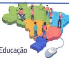
QUADRO Nº 1